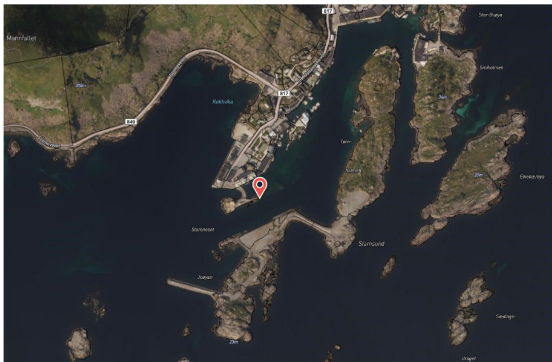
Flyfoto Ytre Stamsund med hurtigrute kai og ny innseiling til indre havn