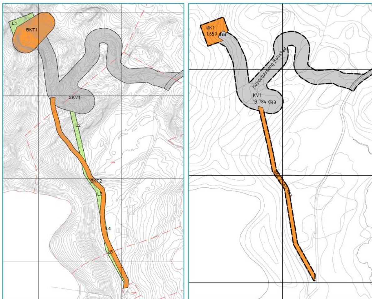
Til venstre: utsnitt av revidert reguleringsplan. Til høyre: utsnitt av gjeldende reguleringsplan. Utarbeidet av Norconsult.