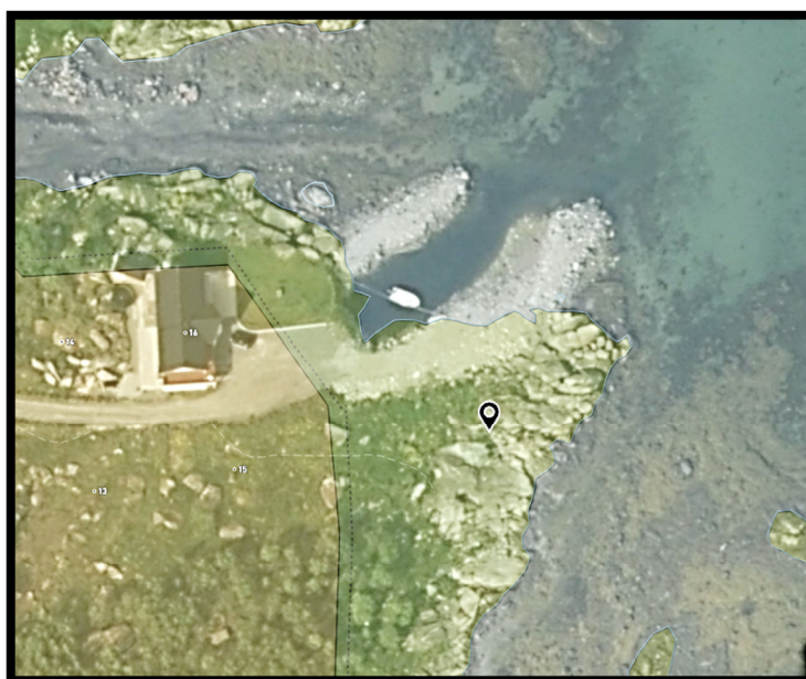
Figur 3 Grønn farge viser naturlig kystkontur – før utdyping og utfylling. Molo til høyre er ca 57 m.