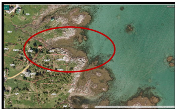
Figur 2 Før inngrep i strandsonen

Det er i rekkefølgebestemmelsene sikret opparbeidelse av sti i friluftsområdet, før det gis brukstillatelse jf. Innspill fra Fylkeskommunen. Opparbeidelse av sti i friluftsområdet, kobles da til reguleringsplan Hellesjyen II.