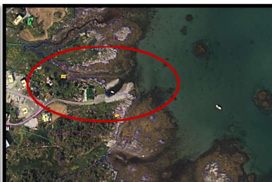
Figur 1 Etter tiltak i strandsonen