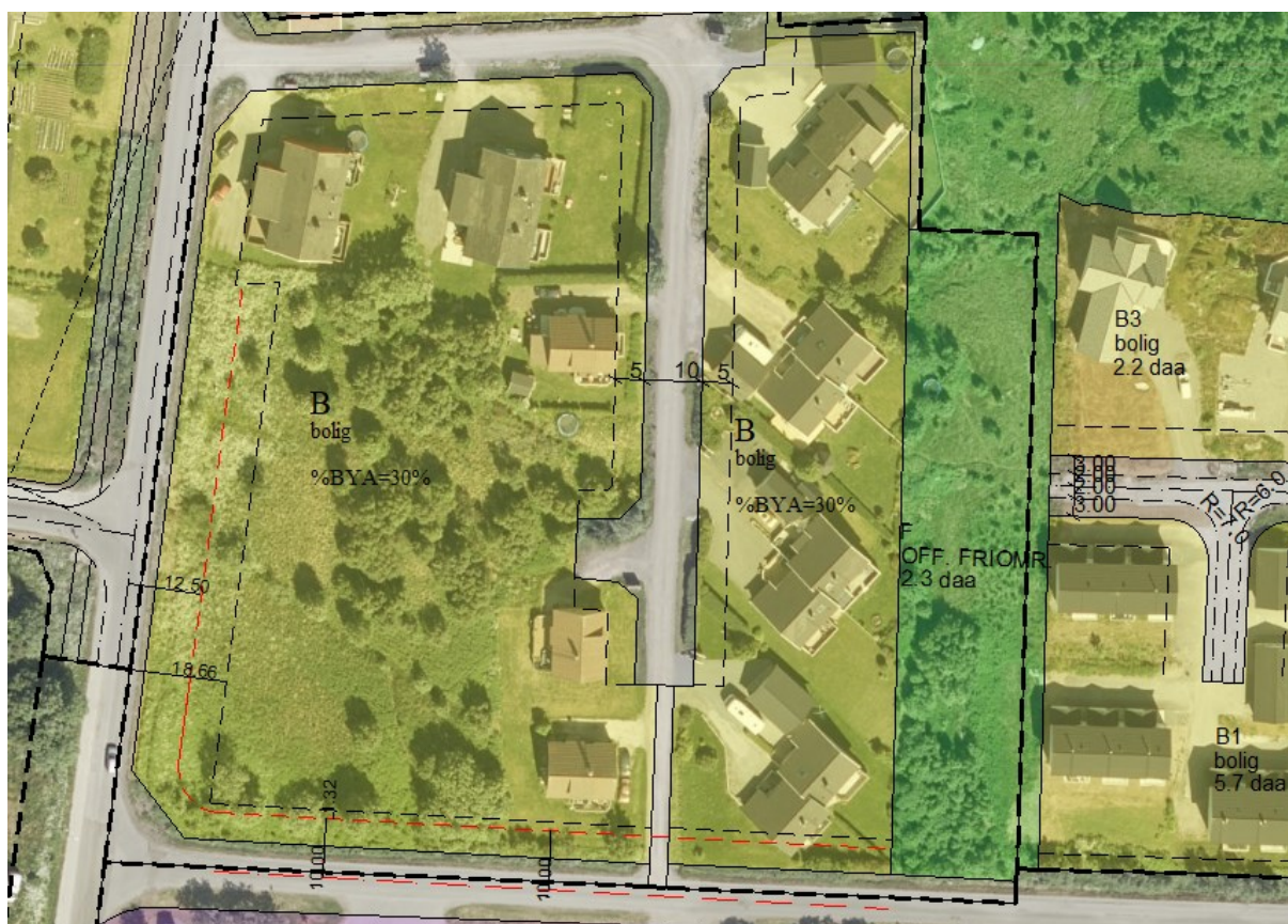
Reguleringsplan med ny byggegrense i rødt