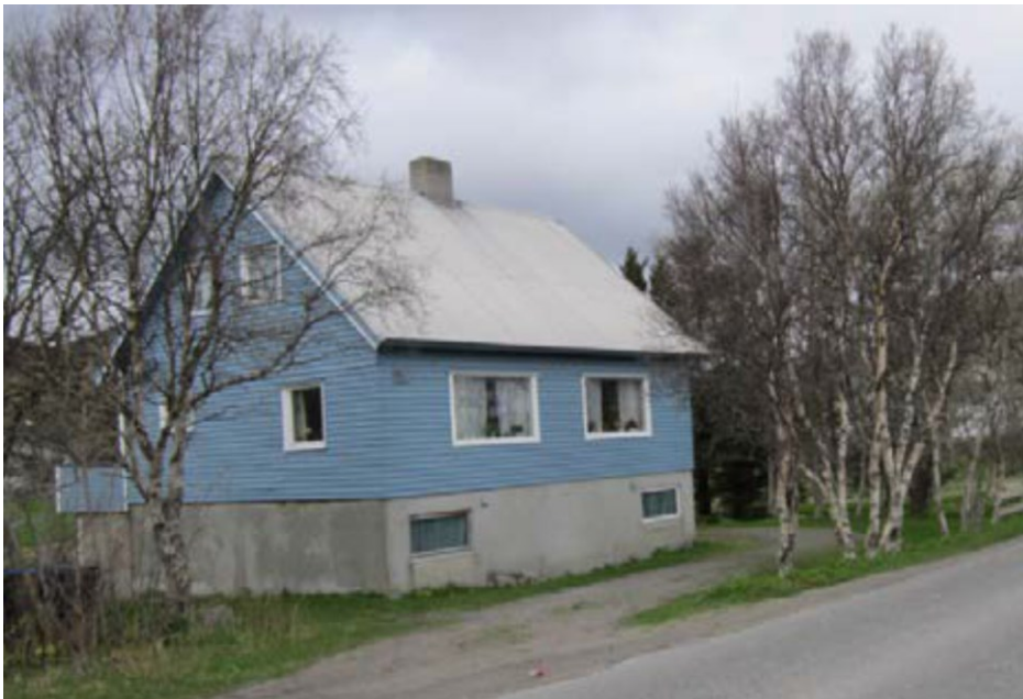
Boligeiendom ved profil 1700, gnr. 15, bnr. 48 og nabotomta, gnr. 15, bnr. 47 foreslås innløst.