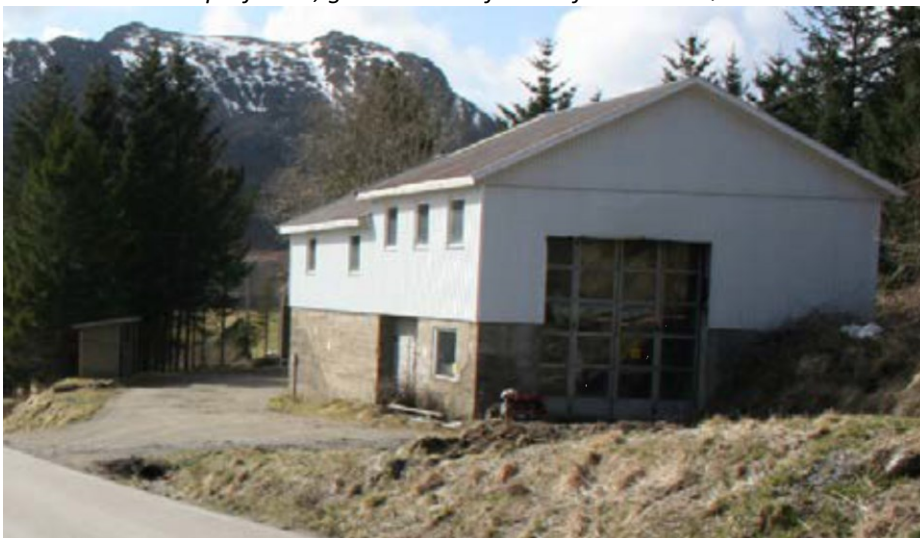
Eldre verksted/lagerbygning som i dag benyttes som lager, Profil 550, gnr. 16, bnr. 1, fnr. 67 foreslås innløst.