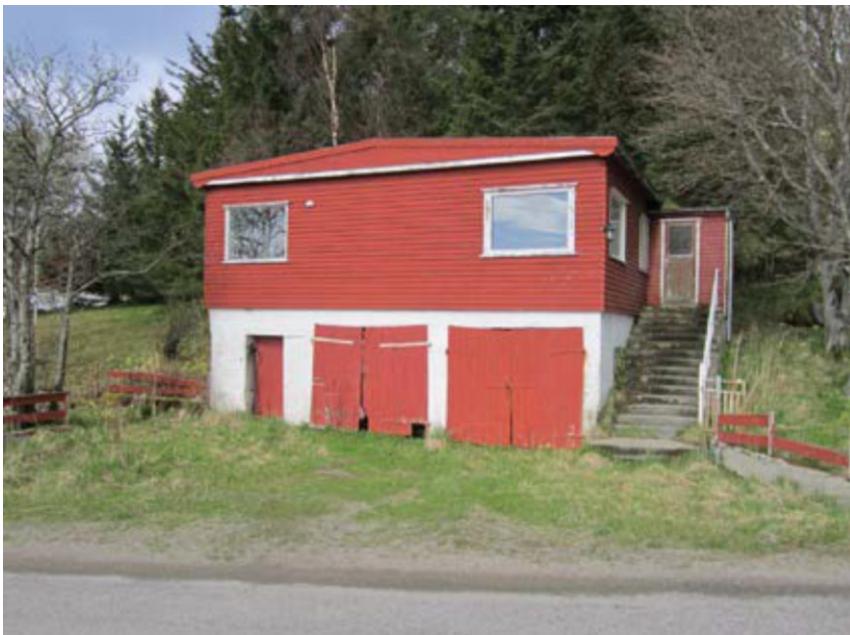
Ubebodd hus ved profil 400, gnr. 16 bnr. 1 fnr. 66. foreslås innløst.

Langs strekningen ligger en del bygninger nært veien. For enkelte vil tiltaket føre til at veien kommer nærmere bebyggelsen. Det er tre bygninger som planlegges innløst som følge av planforslaget: